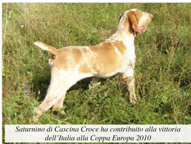
Saturnino di Cascina Croce ha contribuito alla vittoria dell'Italia alla Coppa Europa 2010

A tutti i migliori auguri per il Nuovo Anno!