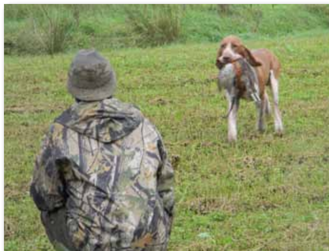
Canaio dell'Oltrepò al riporto. Cond. Rebaschio, Propr. Angelucci