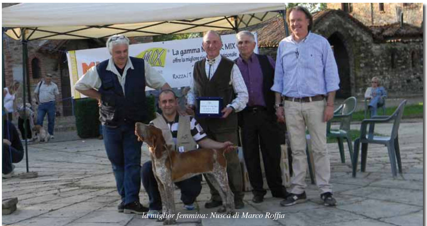
la miglior femmina: Nusca di Marco Roffa

2 ECC Tema di Cascina Croce c. C. Gritti