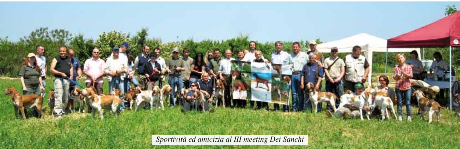
Sportività ed amicizia al III meeting Dei Sanchi