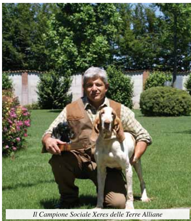
Il Campione Sociale Xeres delle Terre Alliane

N.B. Il verbale dell'Assemblea è pubblicato nel sito www.ilbraccoitaliano.org