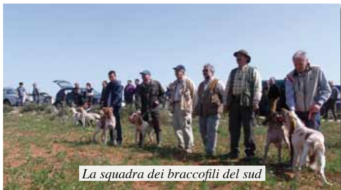
La squadra dei braccofili del sud